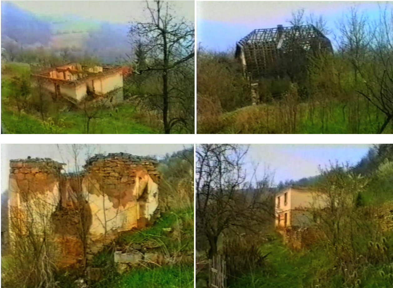
Уништене куће у селу Међе