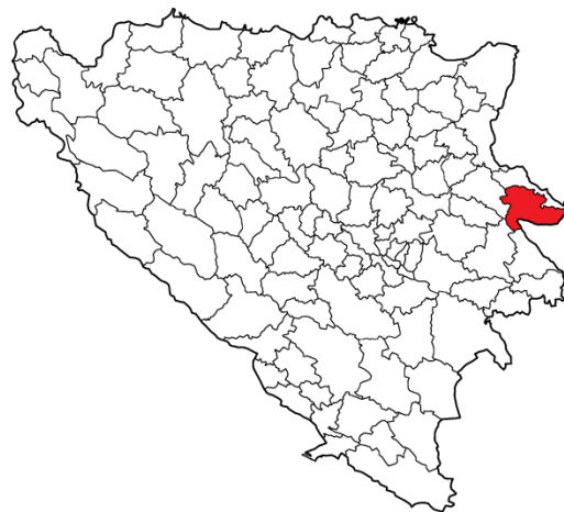
Географски положај општине Сребреница

Општина Сребреница се налази у источном дијелу Босне и Херцеговине. Граничи се са општинама Братунац, Власеница, Рогатица и Вишеград. Површина општине износи 529,83 km 2 . Општина је била састављена од 19 мјесних заједница: Брежани, Црвица, Гостиљ, Костоломци, Крнићи, Лука, Ораховица, Осатица, Подравно, Поточари, Радошевићи, Ратковићи, Сасе, Скелани, Скендеровићи, Сребреница, Сућеска, Топлица, Виогор. У овим мјесним заједницама су се налазила сљедећа насељена мјеста: Бабуљице, Бајрамовићи, Беширевићи, Блажијевићи, Бостаховине, Божићи, Браковци, Брезовице, Брежани, Бучиновићи, Бучје, Бујаковићи, Црвица, Чичевци, Димнићи, Добрак, Доњи Поточари, Фојхар, Гај, Гладовићи, Гођевићи, Горњи Поточари, Гостиљ, Калиманићи, Карачићи, Клотјевац, Костоломци, Крњићи, Крушев До, Кутузери, Лијешће, Ликари, Липовац, Лука, Љесковик, Мала Даљегошта, Међе, Михољевине, Милачевићи, Мочевићи, Ногачевићи, Обади, Опетци, Ораховица, Осатица, Осмаче, Осредак, Пале, Палеж, Пећи, Пећишта, Петрича, Подгај, Подосоје, Подравно, Постоље, Познановићи, Прибидоли, Прибојевићи, Прохићи, Пусмулићи, Рађеновићи, Радошевићи, Радовчићи, Ратковићи, Сасе, Скелани, Скендеровићи, Слатина, Сребреница, Староглавице, Сућеска, Сулице, Шубин, Токољак, Топлица, Урисићи, Велика Даљегошта, Виогор, Жабоквица, Жедањско.