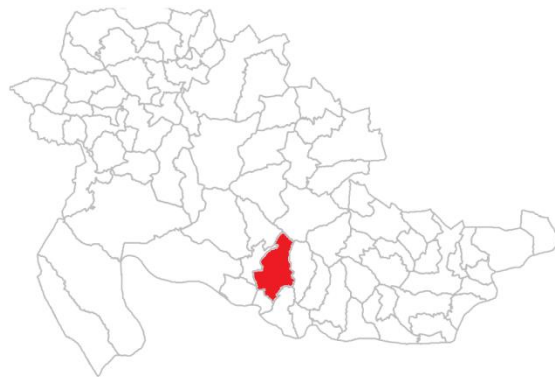
Географски положај села Међе у општини Сребреница.

Површина села Међе износи 8,24 km 2 . Према попису становништва из 1991. године, Међе су имале 217 становника. Национална структура је била сљедећа: Срби 130 (59,9%) и муслимани 87 (40,1%). На попису из 2013. године Међе су имали 61 становника и то Срба 49 (80,3%) и Бошњака 12 (19,7%). 2