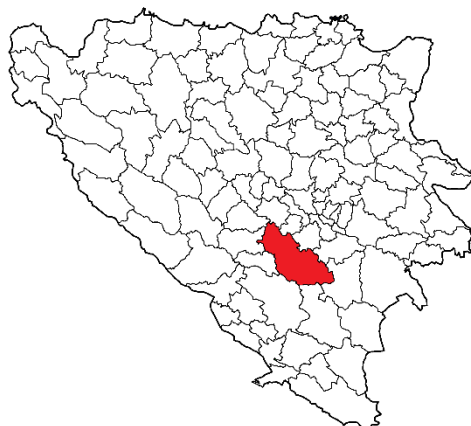
Географски положај општине Коњиц

Калиновик, Трново, Хаџићи, Крешево, Фојница, Горњи Вакуф, Прозор, Јабланица, Мостар и Невесиње. Површина општине износи 1.144,45 km 2 . Општина је била састављена од 28 мјесних заједница: Бијела, Борци, Брадина, Булатовићи, Бутуровић Поље, Центар, Челебићи, Чуховићи, Доње Село, Џанићи, Џепа, Главатичево, Горани, Грабовци, Јасеник, Лисичићи, Невиздраци, Ново Насеље, Оџаци, Ораховица, Парсовићи, Подорашац, Покојиште, Сеоница, Солакова Кула, Спиљани, Стари Град, Трешаница. У овим мјесним заједницама су се налазила следећа насељена мјеста: Аргуд, Бале, Баре, Бармиш, Бијела, Бјеловчина, Блаце, Блучићи, Борци, Бождаревићи, Брадина, Брђани, Будишња Раван, Буковица, Буковље, Булатовићи, Бушчак, Бутуровић Поље, Церићи, Црни Врх, Челебићи, Челина, Чесим, Чичево, Чуховићи, Добричевићи, Долови, Дољани, Доња Вратна Гора, Доње Село, Доње Вишњевице, Доњи Чажан, Доњи Градац, Доњи Невиздраци, Доњи Пријеслоп, Дошчица, Дубочани, Дубравице, Дудле, Дужани, Џајићи, Џанићи, Џепа, Фаланово Брдо, Гакићи, Гаљево, Главатичево, Гобеловина, Горани, Горанско Поље, Горица, Горња Вратна Гора, Горње Вишњевице, Горњи Чажан, Горњи Градац, Горњи Невиздраци, Гостовићи, Грабовци, Градељина, Грушћа, Хасановићи, Херићи, Хоматлије, Хомоље, Хондићи, Идбар, Јасеник, Јаворик, Језеро, Жежепросина, Јошаница, Кале, Кањина, Кашићи, Коњиц, Костајница, Кото, Крајковићи, Кралупи, Кртићи, Крупац, Крушћица, Кула, Лађаница, Лисичићи, Локва, Лука, Лукомир, Лукшије, Љесовина,