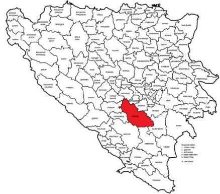
Географски положај општине Коњиц

Општина је била састављена од 28 мјесних заједница: Бијела, Борци, Брадина, Булатовићи, Бутуровић Поље, Центар, Челебићи, Чуховићи, Доње Село, Џанићи, Џепи, Главатичево, Горани, Грабовци, Јасеник, Лисичићи, Невиздраци, Ново Насеље, Оџаци, Ораховица, Парсовићи, Подорашац, Покојиште, Сеоница, Солакова Кула, Спиљани, Стари Град, Трешаница. У овим мјесним заједницама су се налазила следећа насељена мјеста: Аргуд, Бале, Баре,