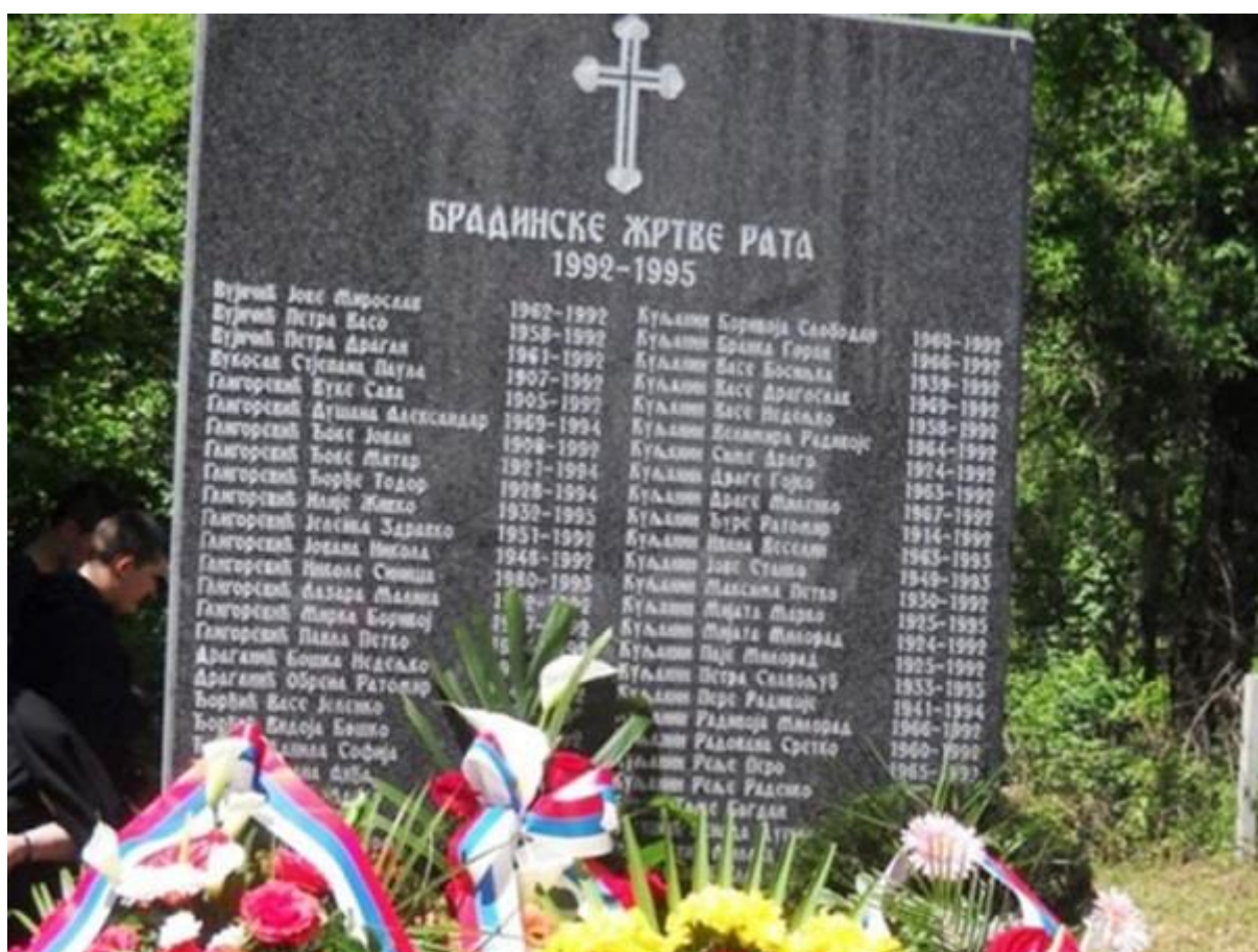
Споменик српским жртвама у Брадини