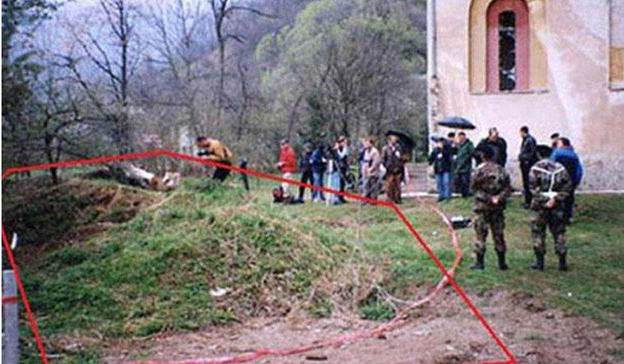
Ексхумација српских жртава из Брадине из масовне гробнице у дворишту Цркве Вазнесења Господњег