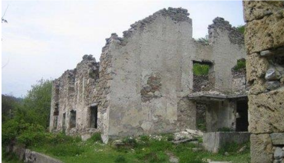
Остаци српских кућа у Брадини