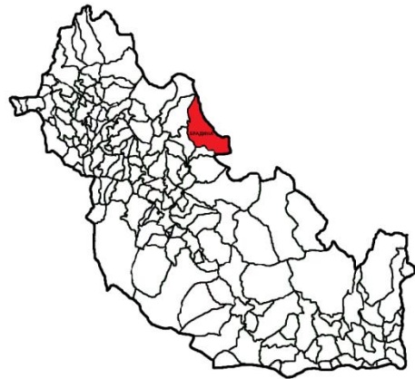
Географски положај Брадине

Брадина је мјесто у општини Коњиц. Укупна површина насеља износи 19,67 km 2 . Према попису становништва из 1991. године у Брадини је живјело 665 становника, националну структуру становника су чинили: Срби 603 (90,7%), Хрвати 32 (4,8%), муслимани 16 (2,4%), Југословени 12 (1,8%) и остали и непознато два (0,3%). Према резултатима пописа становништва из 2013. године у Брадини живи 72 становника, националну структуру становника чине: Срби три (4,2%), Хрвати три (4,2%) и Бошњаци 66 (91,7%) 3 .