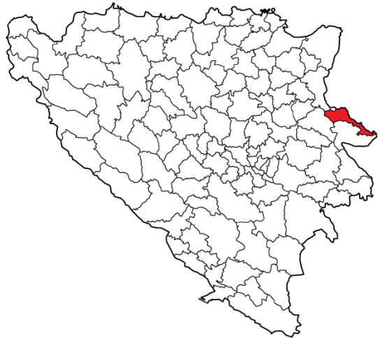
Географски положај општине Братунац

Бјеловац, Бљечева, Братунац, Факовићи, Глогова, Хранча, Коњевић Поље, Кравица, Осамско, Подчауш, Суха, Вољевица и Жлијебац. У овим мјесним заједницама су се налазила следећа насељена мјеста : Абдулићи, Бањевићи, Биљача, Бјеловац, Бљечева, Бољевићи, Брана Бачићи, Братунац, Дубравице, Факовићи, Глогова, Хранча, Јагодња, Јакетићи, Јелах, Јежештица, Јошева, Коњевићи, Красановићи, Кравица, Липеновићи, Лозница, Магашићи, Михаљевићи, Млечва, Мратници, Оченовићи, Оправдићи, Пирићи, Побрђе, Побуђе, Подчауш, Полон, Раковац, Реповац, Сикирић, Слапашница, Станатовићи, Суха, Шиљковићи, Тегаре, Урковићи, Витковићи, Вољавица, Вранешевићи, Загони, Залужје, Запоље, Жлијебац.