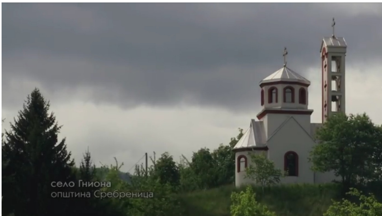
Црква у засеоку Гниона, детаљ из филма „Злочин без казне“.