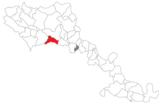
Географски положај насеља Бљечева у општини Братунац

Насеље Бљечева припада општини Братунац, а налази се западно од самог урбаног језгра Братунца. Површина села Бљечева износи 4,89 km 2 . Према попису становништва из 1991. године Бљечева је имала укупно 609 становника, од чега је етнички састав становништва изгледао овако: Срби 71 (11,7%), Муслимани 532 (87,4%) и осталих шест (1%). Насеље Бљечева, према попису становништва из 2013. године, има 195 становника, а по националној структури Бошњака има 194 (99,5%) и једног становника који се изјашњава као остали. Срба више нема у Бљечеви.