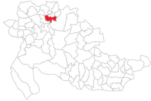
Географски положај насеља Гостиљ, чији је саставни дио Гниона, у општини Сребреница

Село Гниона потпада под МЗ Гостиљ. Гниона је село које је било насељено искључиво српским становништвом. Међутим, овдје ћемо анализирати етнички састав насеља Гостиљ у оквиру кога је и Гниона. Према попису становништва из 1991. године, у Гостиљу је живјело 148 становника. Етничка структура је била сљедећа: Срби 113 (76,4%) и муслимани 35 (23,6%). На првом послијератном попису становништва из 2013. године, Гостиљ је имао 503 становника, а етнички састав је био сљедећи: Срби 266 (52,9%), Бошњаци 235 (46,7%) и осталих два (0,4%) 10 .