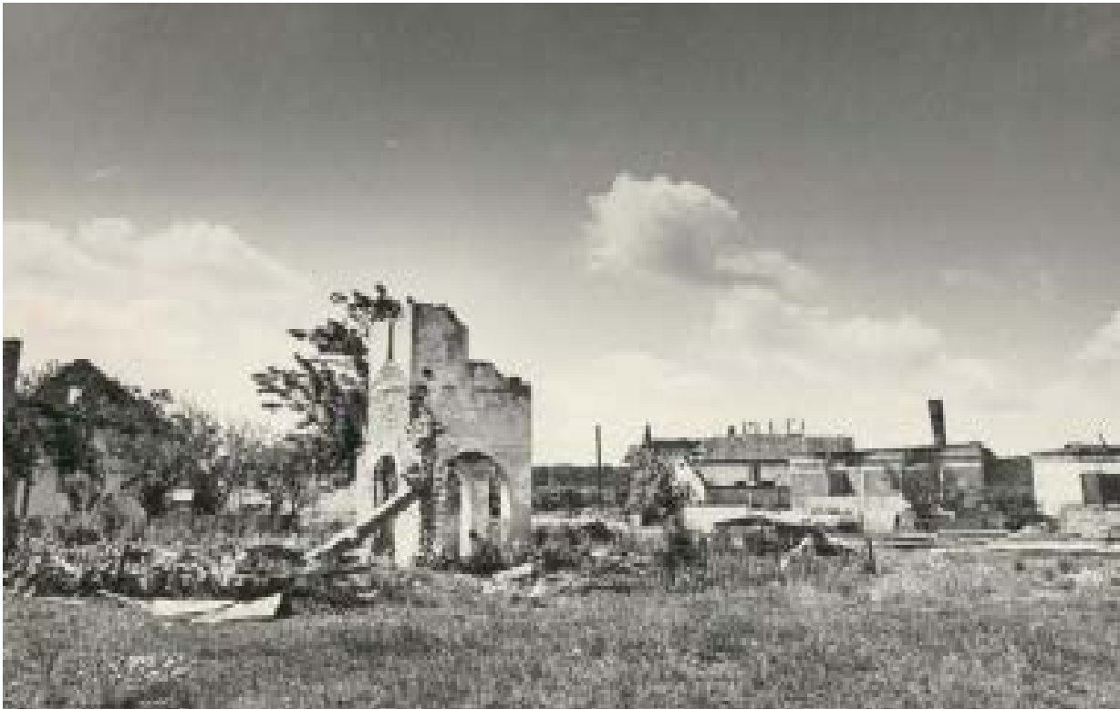
Село Сијековац и српска православна Црква Свете Огњене Марије након хрватског похода последњих дана марта 1992. године

И наредних дана, за вријеме окупације Сијековца од стране хрватских војних и паравојних јединица настављено је са убијањем српских цивила, злостављањем и одвођењима у логоре, а српска имовина је систематски и плански пљачкана и уништavana. Након што је првог дана напада убијено девет лица, до ослобађања Сијековца од стране Војске Републике Српске у октобру 1992. године убијено је још најмање 11 мјештана Сијековца. Такође, уништена је и Црква Свете Огњене Марије у овом селу.